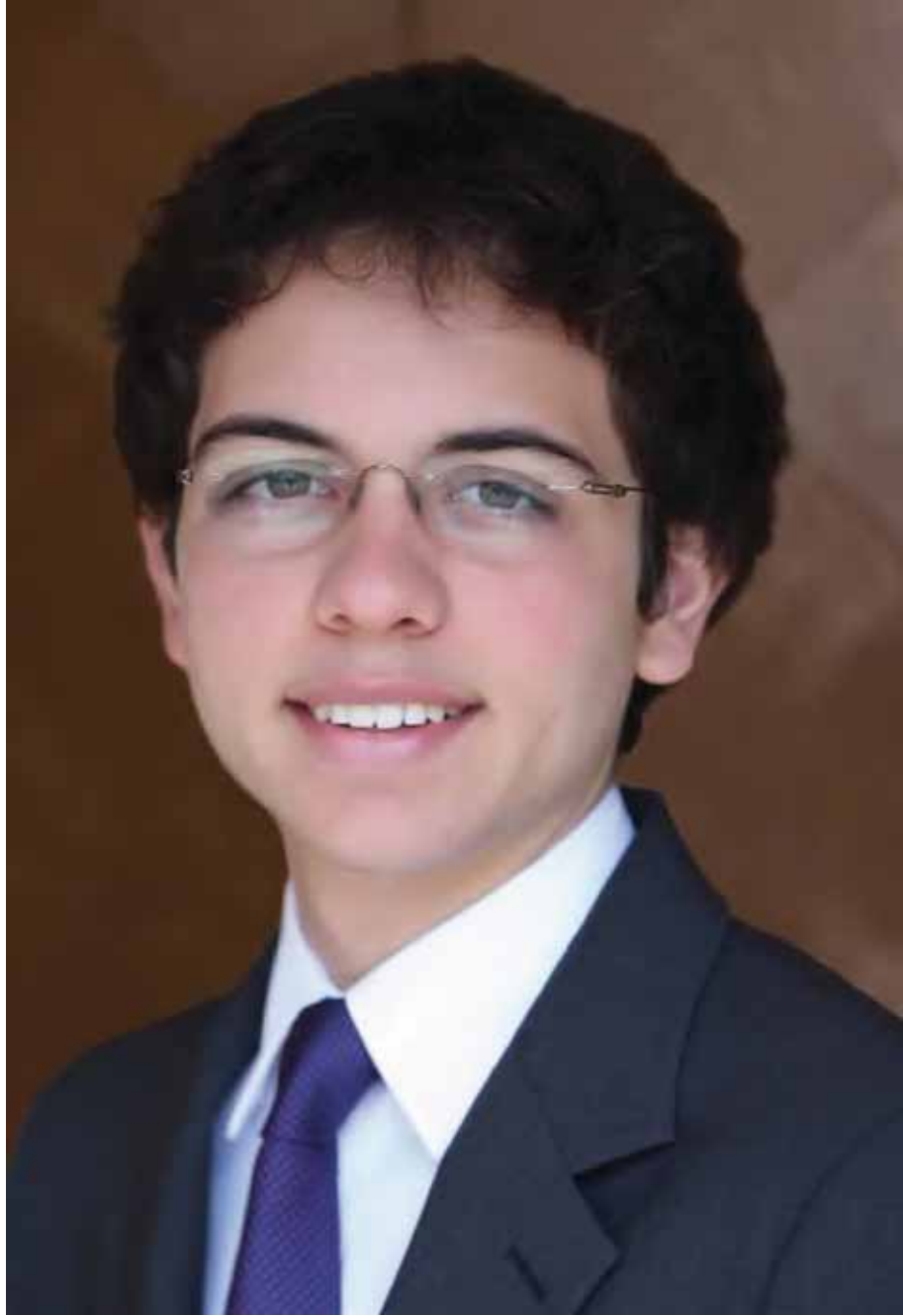
حضرة صاحب السمو الملكي الأمير الحسين ولي العهد المعظم