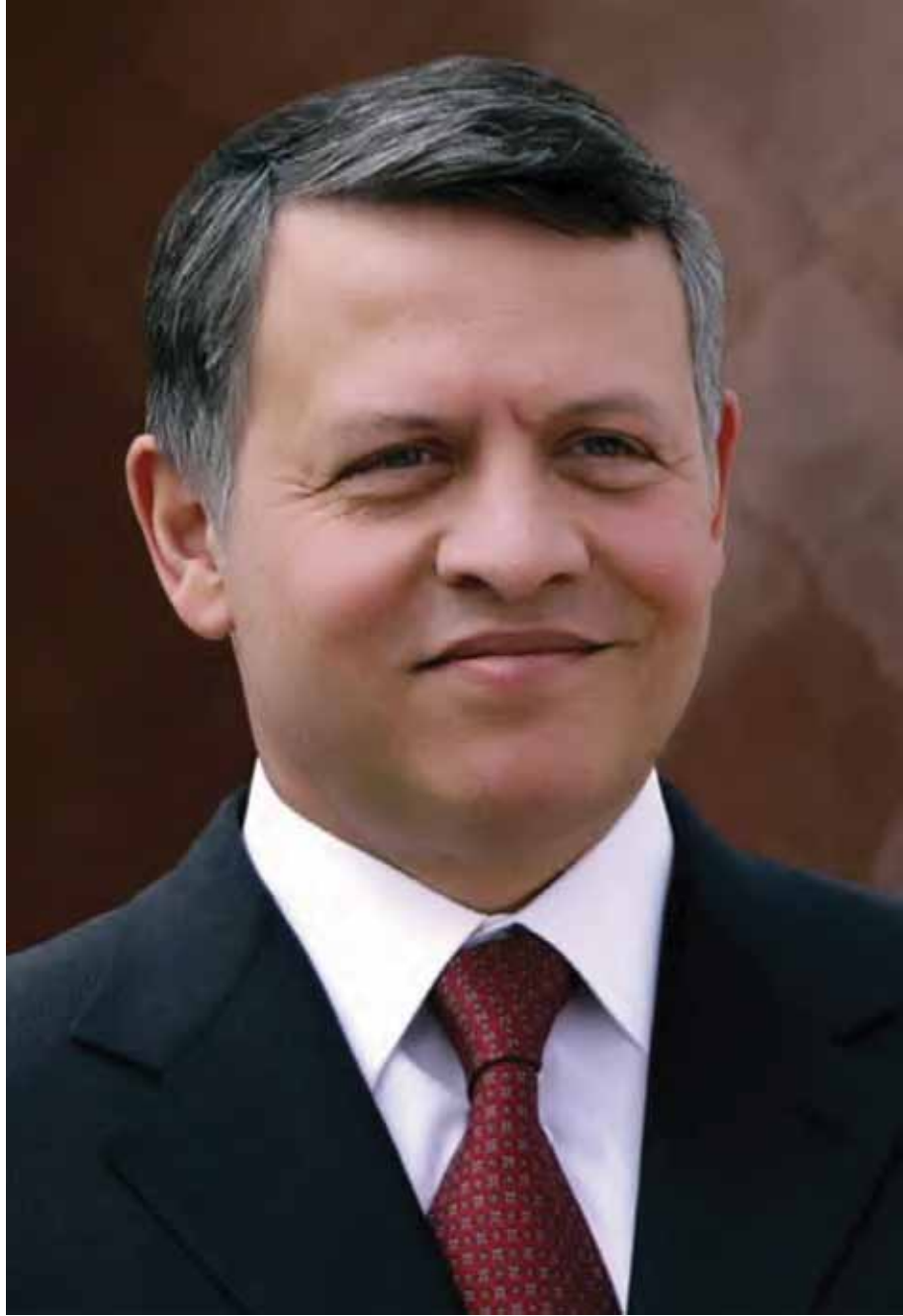
حضرة صاحب الجلالة الملك عبد الله الثاني ابن الحسين المعظم