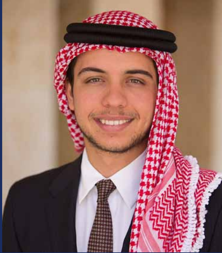
حضرة صاحب السمو الملكي الأمير الحسين بن عبد الله الثاني ولي العهد