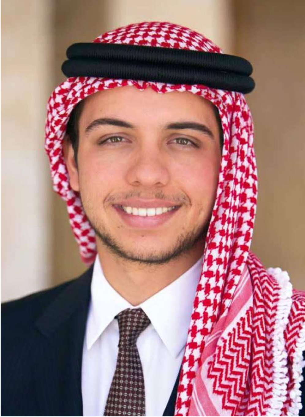
حضرة صاحب السمو الملكي الأمير الحسين بن عبد الله الثاني ولي العهد المعظم