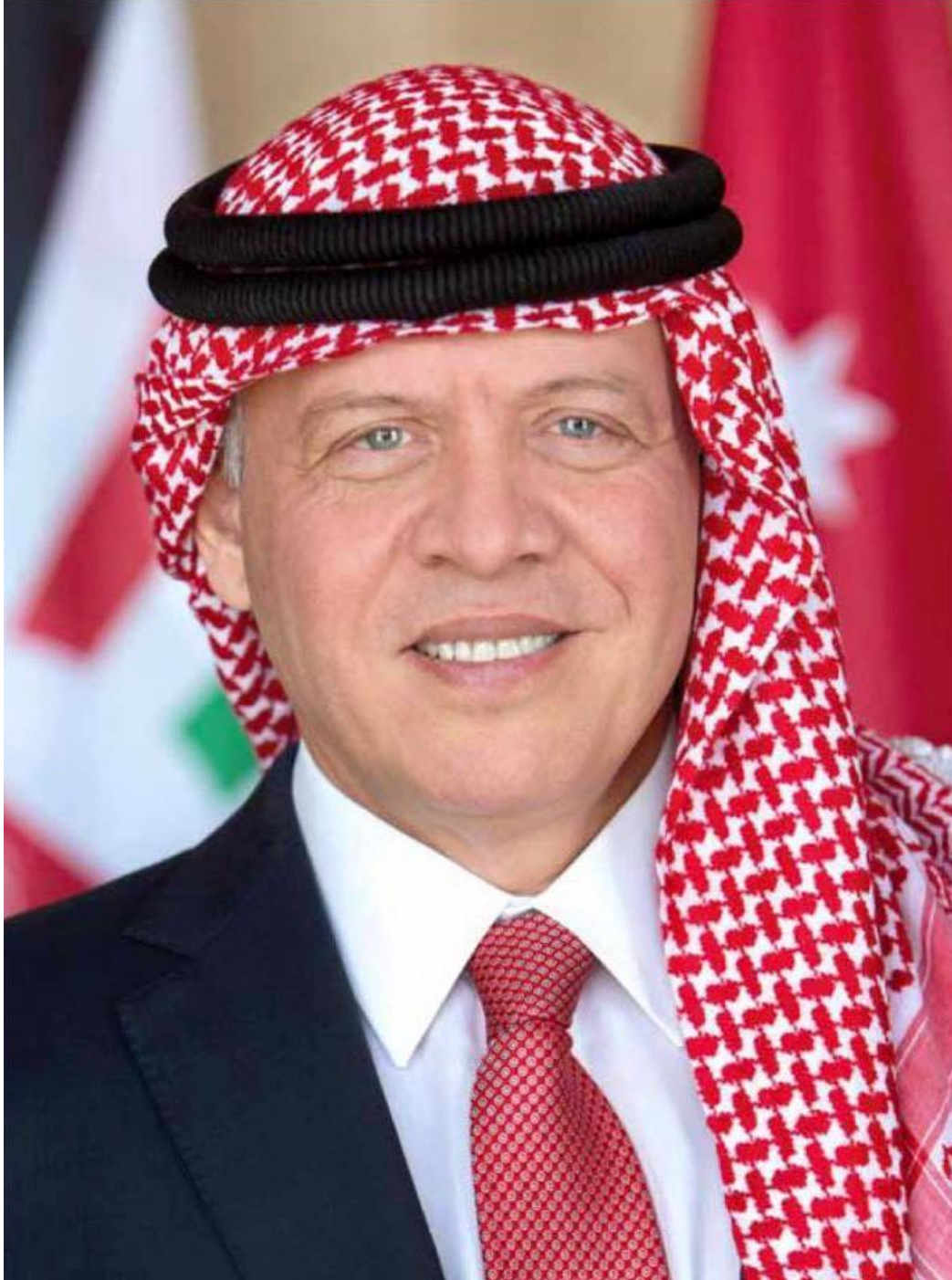
حضرة صاحب الجلالة الملك عبد الله الثاني ابن الحسين المعظم